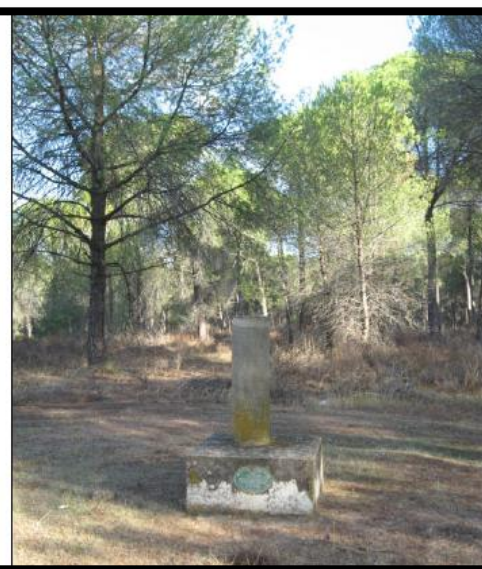
Figura 40- Vértice Geodésico Red Regente Nº100127

A partir de estos vértices geodésicos se colocaron las Bases que se distribuyeron uniformemente, a lo largo de toda la zona afectada por el abastecimiento. Con una distancia máxima de 2.5 km entre ellas.