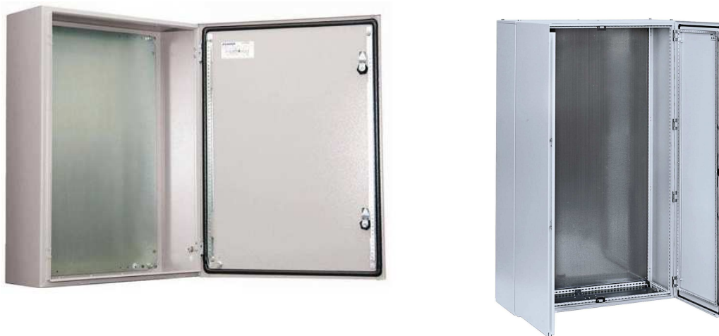
Figura 1. Armarios Eléctricos